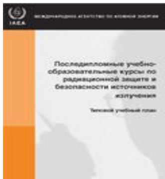
4 марта – 26 июня 2019 Аккра Гана Accra, Ghana

Совет обычно собирается пять раз в год – в марте и июне, дважды в сентябре (до и после сессии Генеральной конференции) и в ноябре.