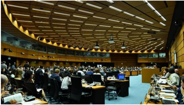
4 – 8 марта 2019 Вена Австрия Vienna, Austria